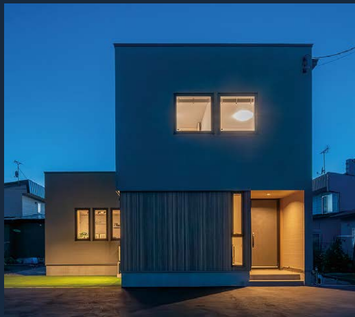
光が際立つモダンな夜の顔となる外観デザイン