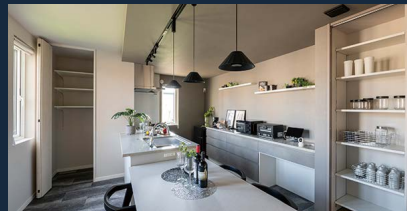
収納充実のダイニングキッチン