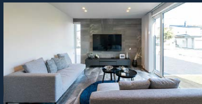
大開口から光が差し込む21.5帖のLDK