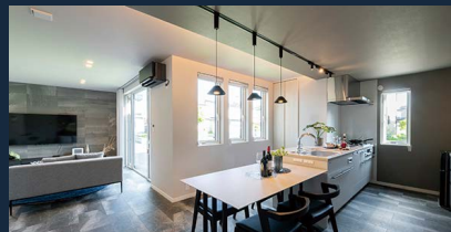
LDKはスムーズな動線が魅力