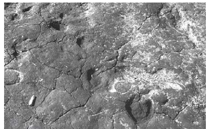
▲ユカンボシC2遺跡の馬の足跡

かつて千歳にいた馬のように、埋蔵文化財センターも皆様の日々の生活の彩りに欠かせない存在となれるように頑張ります。今年もよろしくお願い申し上げます。