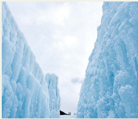
▲「支笏湖ブルー」に輝く氷像

1月31日、千歳・支笏湖氷濤(ひょうとう)まつりが開幕しました。昨年は13万1千人もの方々にご来場いただき、土日祝日はもちろん、平日も大変にぎわいを見せました。支笏湖駐車場の運営管理をしている自然公園財団支笏湖支部職員として氷濤まつりの混雑状況について解説します。一番混みあうのはもちろん土日祝日です。昨年実績で言うと、一番混雑したのはさっぽろ雪まつりの週の土日祝日と最終週の三連休でした。どの週でも15時台、遅くとも16時には渋滞が始まること多いです。臨時駐車場も3箇所ご用意し最大限の渋滞解消に努めていますが、渋滞に巻き込まれないよう、早め早めのご来場をお願いします。夕方から渋滞が起こる理由は簡単、みなさんライトアップに目掛けていらっしゃるからです。支笏湖の近隣である千歳・恵庭に住むみなさんに声を大にしてお伝えしたいのは、「昼の青い氷像がとってもキレイです！」ということです。